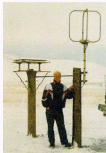
Mælistöðvarnar samanstanda af rafsviðsmælingu (tvær plötur) og segulsviðsmælingu (hringlaga loftnet). Mælingarnar eru síðan forunnar í tölvu sem er á mælistaðnum en móðurstöð hjá Veðurstofunni safnar upplýsingunum frá þeim saman og birtir á veraldarvefnum.