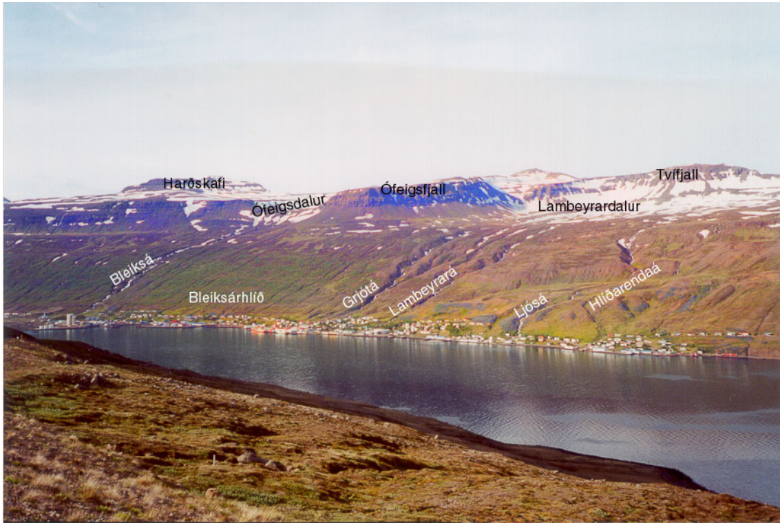
Mynd 1: Eskifjörður. Helstu örnefni.