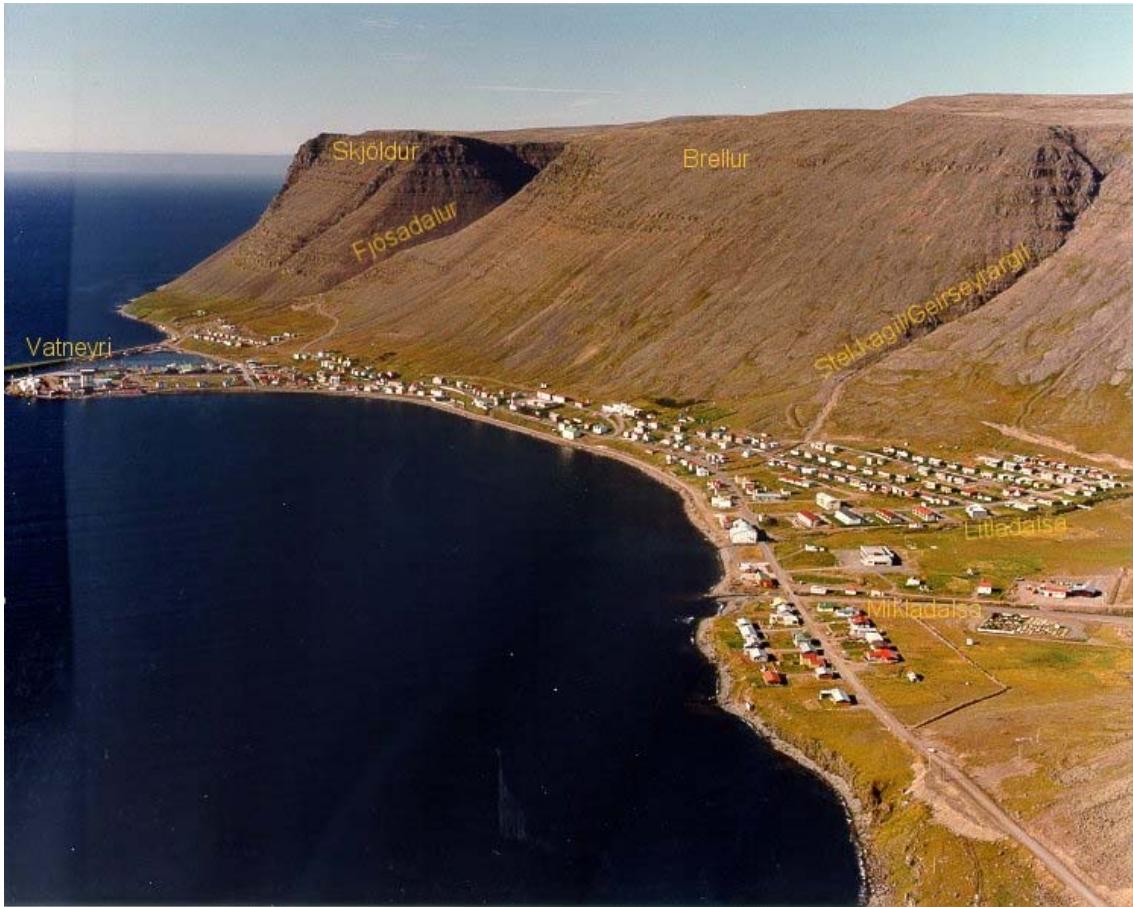
Mynd 2: Patreksfjörður. Helstu örnefni.