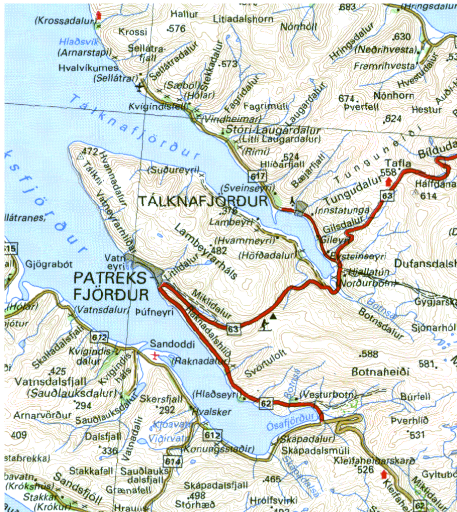
Mynd 1: Yfirlitskort af nágrenni Patreksfjarðar.