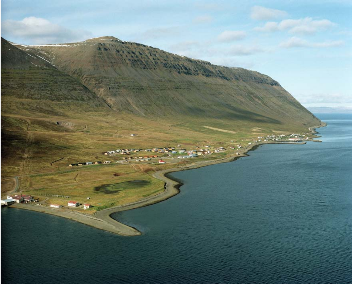
Mynd 3: Súðavík eftir flutning byggðarinnar (10. september 1997).