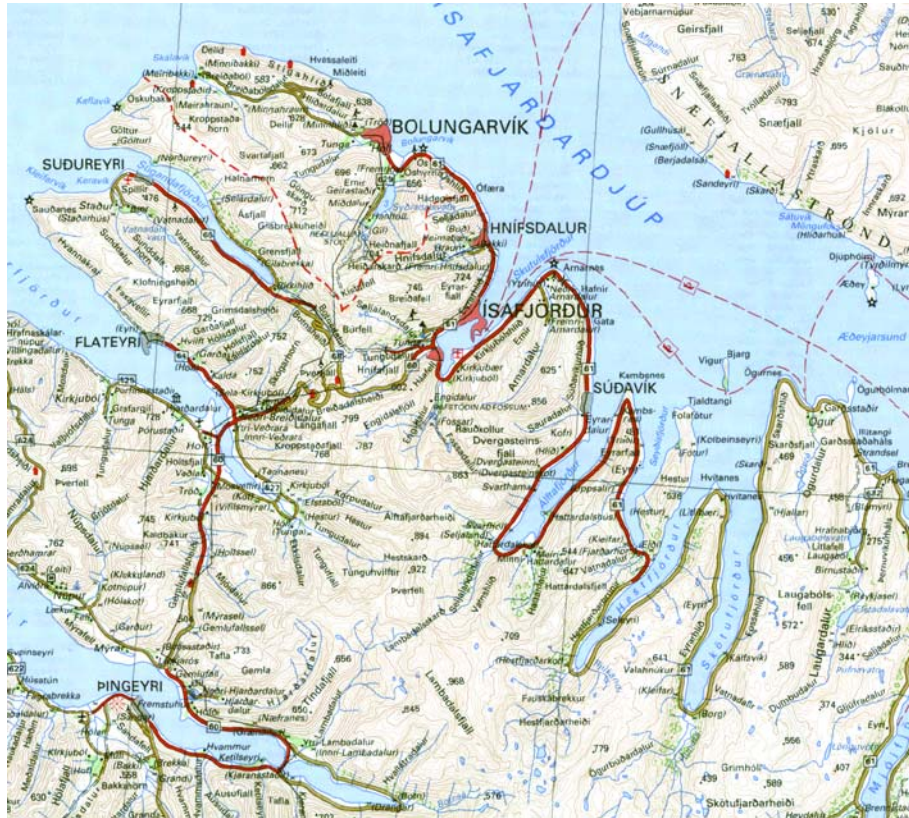
Mynd 1: Yfirlitskort af nágrenni Súðavíkur og Ísafjardardjúps.