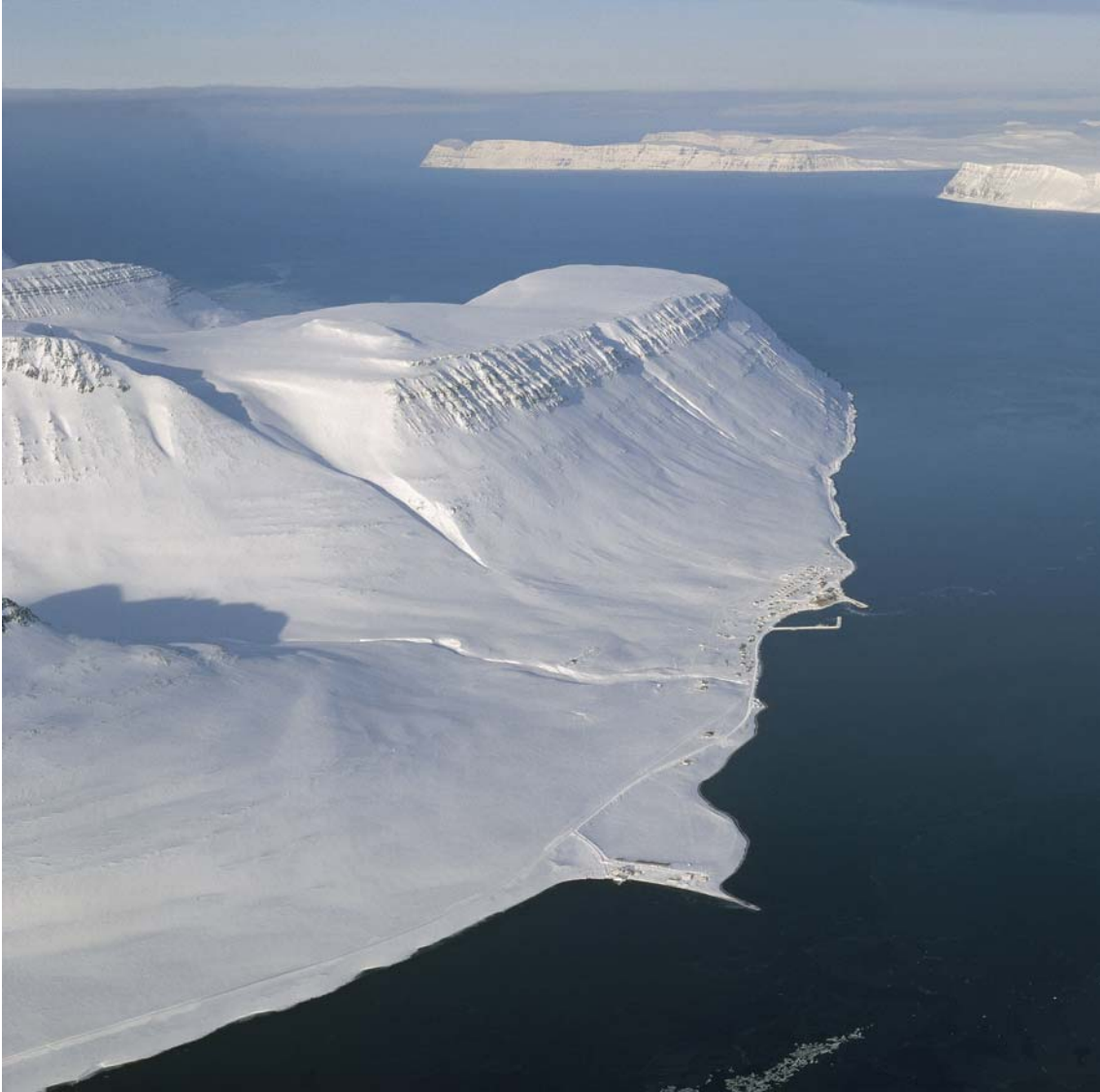
Mynd 2: Súdavík fyrir snjóflóðin í janúar 1995 (1. mars 1989).